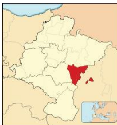
Ubicación de Comarca de Sangüesa

La comarca se encuentra situada en la parte centro-oriental de la Comunidad Foral de Navarra dentro de la zona geográfica denominada Navarra Media Oriental, por ella discurre el curso del Río Aragón. La comarca tiene 467,02 km 2 de superficie y limita al norte con las comarcas de Aoiz y Lumbier, al este con la provincia de Zaragoza, al sur con la Ribera Arga-Aragón y al oeste con la comarca de Tafalla.